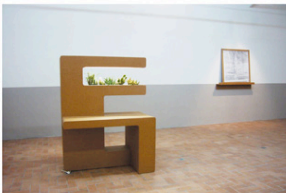
Vue de l'exposition d'Andrea Blum « Still-Life » à la Galerie In Situ / Fabienne Leclerc à Paris. > Jusqu'au 16 février - www.insituparis.fr