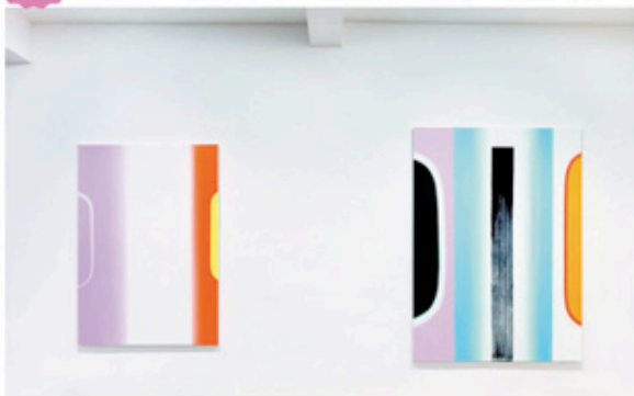
Vue de l'exposition d'Alain Séchas à la Galerie Chantal Crousel à Paris. > Jusqu'au 19 janvier - www.crousel.com