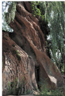
À gauche : Guillaume Janot, Building , 2011, photographie couleur montée sur châssis, 5 exemplaires, 42 x 28 cm. Courtesy Galerie Alain Gutharc, Paris. À droite : Guillaume Janot, Concrete , 2011, photographie couleur, 5 exemplaires, 110 x 73,5 cm. Courtesy Galerie Alain Gutharc, Paris. > Jusqu'au 23 février - http://alaingutharc.com