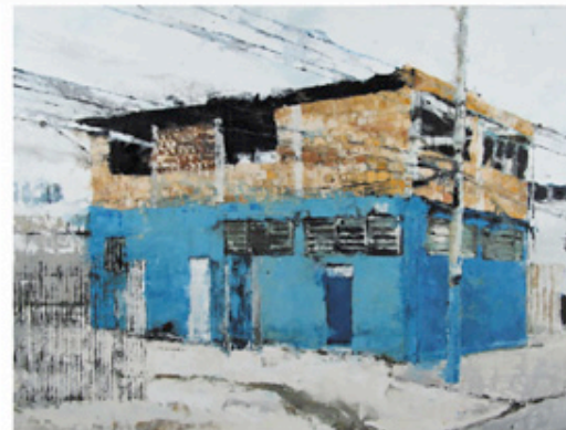
Philippe Cognée, Mexico 2 , 2012, peinture à la cire sur toile, 153 x 200 cm. Toile de la série « Les architectes » exposée à la Galerie Daniel Templon. > Jusqu'au 23 février - www.danieltemplon.com