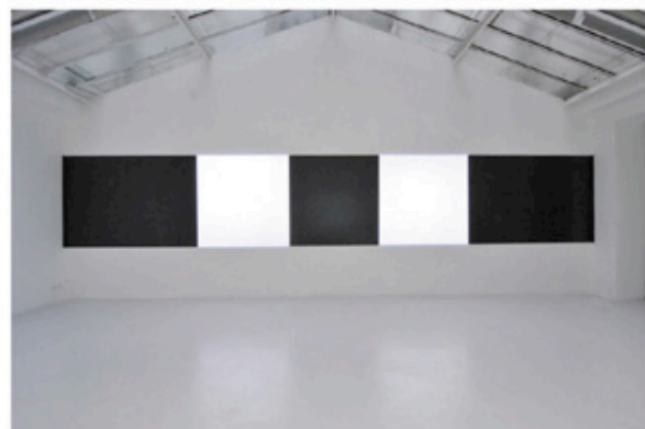
Vue de l'exposition « Light from matter / matter from light », David Tremlett & Michel Verjux, à la Galerie Jean Brolly à Paris. > Jusqu'au 9 février - www.jeanbrolly.com