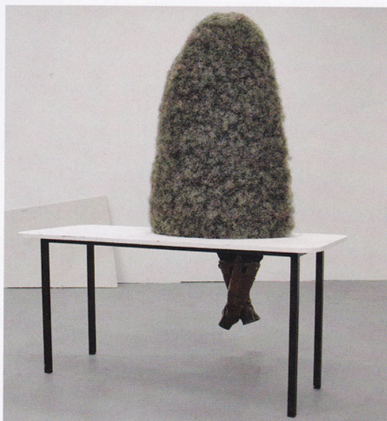
Nicolas Momein, Développé cardé , 2011, acier, crin, 104 x 62 x 37 cm (GALERIE WHITEPROJECT, PARIS).

« HEIMO ZOBERNIG », galerie Chantal Crousel, 10, rue Charlot, 75003 Paris 01 42 77 38 87 http://crousel.com et La Douane, 1, rue Léon-Jouhaux, 75010 Paris 01 42 01 64 97 du 21 janvier au 2 mars.