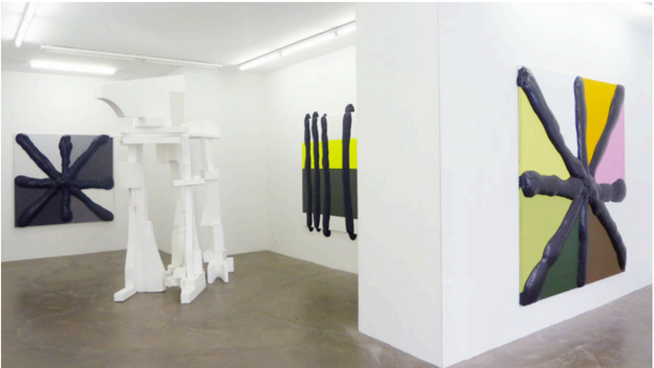
Vue de l'exposition