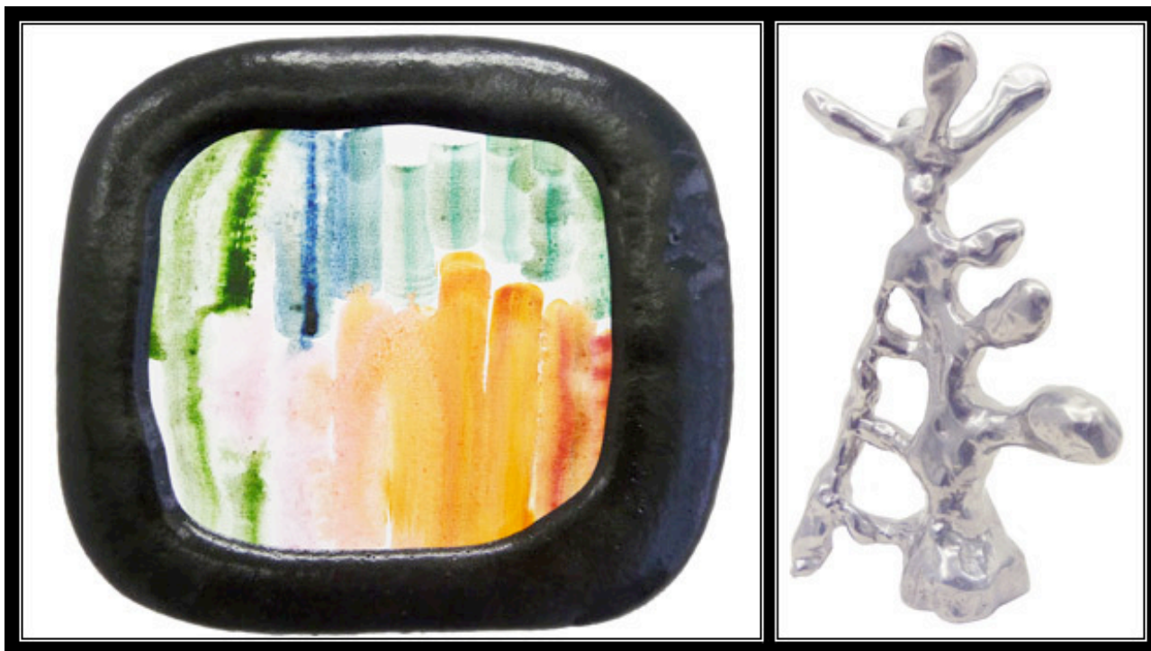
Photo 1 : "Auto-encadré #1", Bernard Quesniaux, 2012, Peinture, mousse polyuréthane, 30 x 27 cm - Photo 2 : "Brenda", Bernard Quesniaux, 2012, Fonte d'aluminium, 5 exemplaires, 28 x 14 x 9 cm