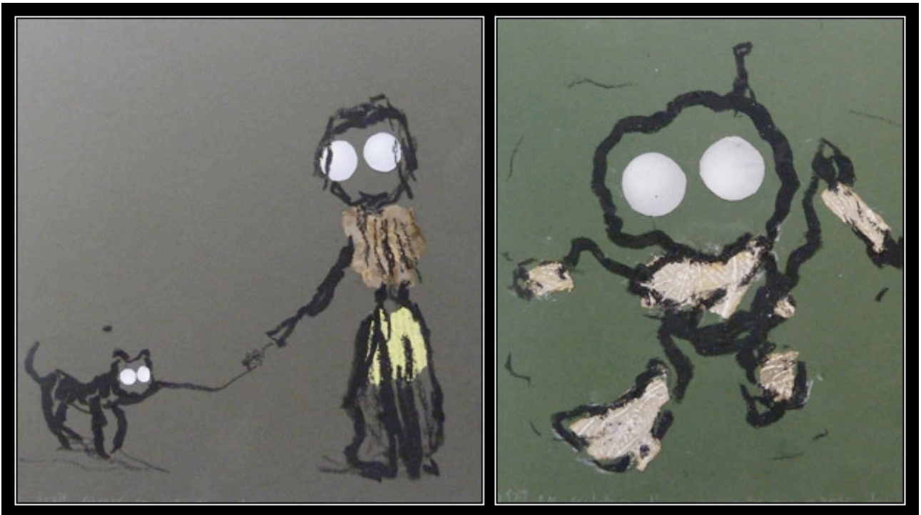
Photo 1 : Elle avait échangé ses enfants contre un chaton de l'armée, Série "Les Mensonges", Bernard Quesniaux, 2012, techniques mixtes sur papier cartonné, 24 x 30 cm - Photo 2 : Il a fait une sculpture d'un cosmonaute qui mange des Lasagnes, Série "Les Mensonges", Bernard Quesniaux, 2012, Techniques mixtes sur papier cartonné, 20,5 x 25 cm © Bernard Quesniaux / Courtesy Galerie Alain Gutharc