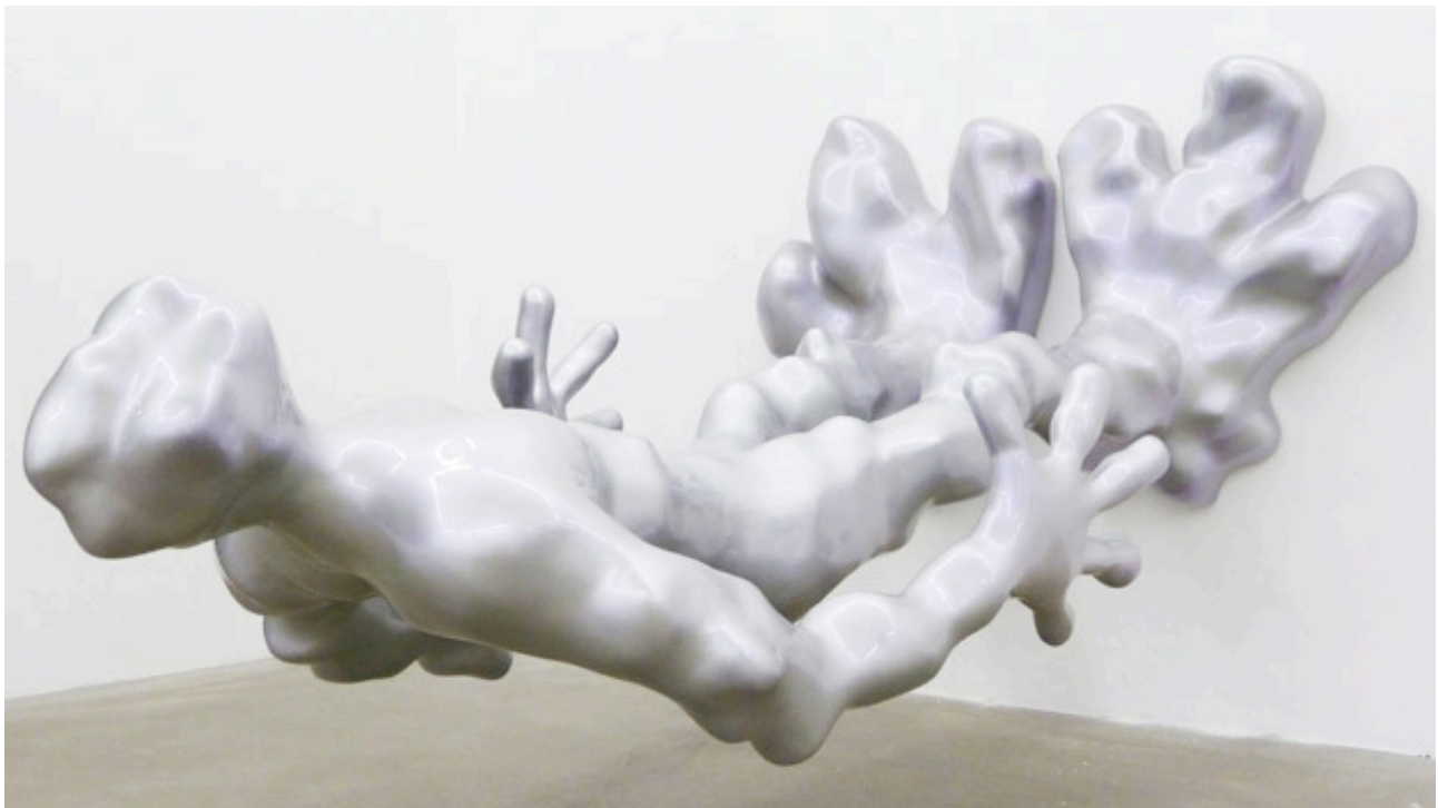
La question du socle , Bernard Quesniaux, 2010, Fibre de verre, résine, laque, Env. 190 x 110 x 75 cm