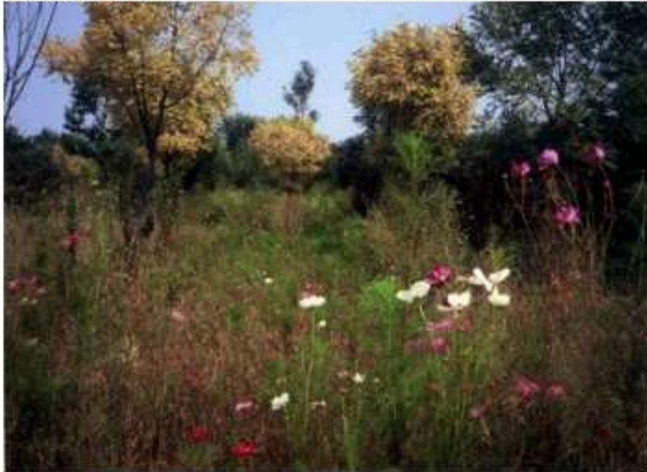
Ecostream, Chaoyang Park, Beijing, été 2008, 2009 Image murale, 365 x 490 cm

Aussi à trop vouloir coller un sens écolo à tout ce que je vois en ce moment, j'avoue m'être laissé avoir par le titre "Ecostream" qui n'est autre en réalité que le nom d'un grand parc public de Pékin, où le promeneur peut s'immerger dans une campagne fleurie, idyllique où l'illusion de nature (à la fois sauvage et rassurante) est savamment mise en scène.